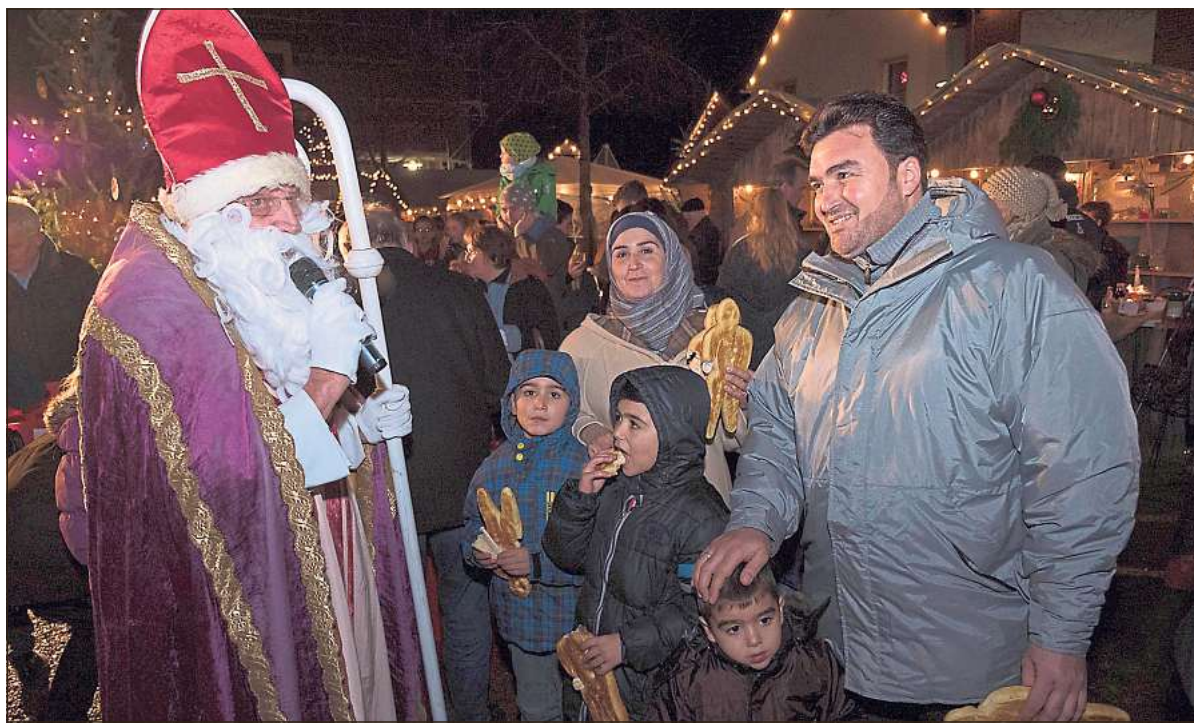
Für diese syrische Flüchtlingsfamilie, die erst vor wenigen Tagen in Ostenfelde angekommen war, bot der Weihnachtsmarkt im Dorfkern eine schöne Abwechslung. Der Nikolaus hatte auch für die Kinder der Flüchtlingsfamilie einen Stutenkerl mitgebracht.